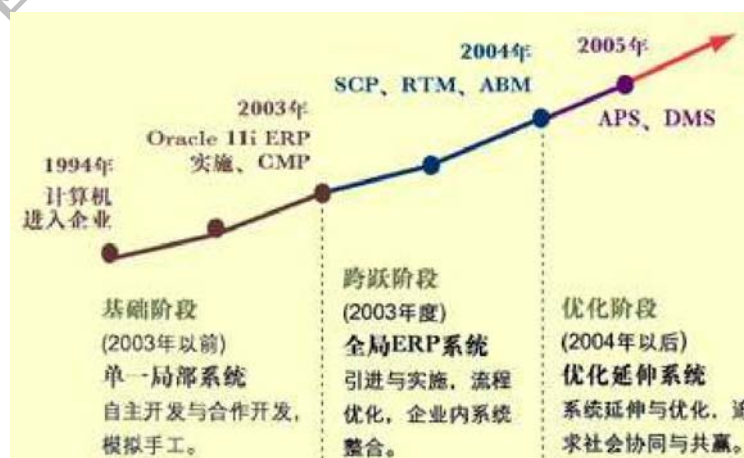
图 2-2 美的生活电器事业部信息化发展历程

ERP 平台的构建不仅帮助美的实现了采购、制造、销售和财务各模块的集中式管理，同时为实现以美的为核心，实时连接 1,000 多家供应商和渠道分销商的供应链管理体系奠定基础。2004 年围绕 ERP 这一基础平台，美的生活电器向供应链的上下游两端延伸，打通所有价值链。对于上游的供应商，构建供应商协作管理(SRM)平台，实现电子化订单管理和网上对帐等多项功能；对于下游分销商，则实现经销商、维修网点和零售终端销售状况的实时管理。其信息化发展历程如下图 2-2 所示。